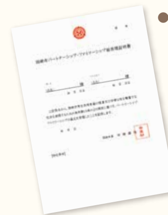
●受理証明書 (A4サイズ)

受理証明書・受理証明カードに記入するお名前は、通称もご使用いただけます。ご希望の場合は、日常生活において当該通称を使用していることが確認できる資料の提示をお願いいたします。