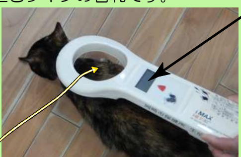
この辺りの皮膚の下に15桁の番号が内蔵された マイクロチップが埋め込まれています。