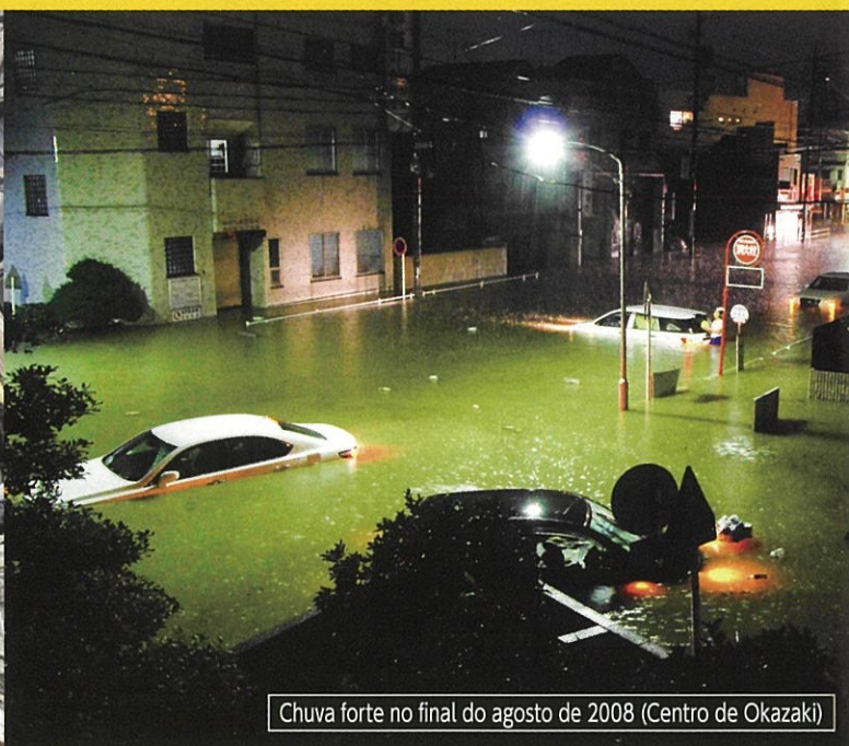
Chuva forte no final do agosto de 2008 (Centro de Okazaki)

Informações sobre terremotos, chuvas fortes, alerta para inundações, recomendação para evacuações e etc.