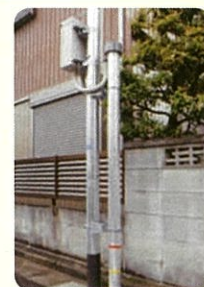
Indicador de Inundação

※Poderá verificar os locais de instalação através das "Explicações sobre o Serviço" no momento do cadastro.