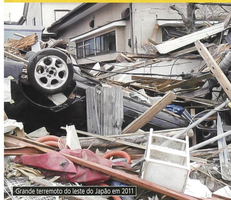
Grande terremoto do leste do Japão em 2011