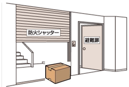
障害物があり、防火シャッターが閉まらない