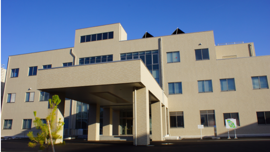
男川浄水場・管理棟