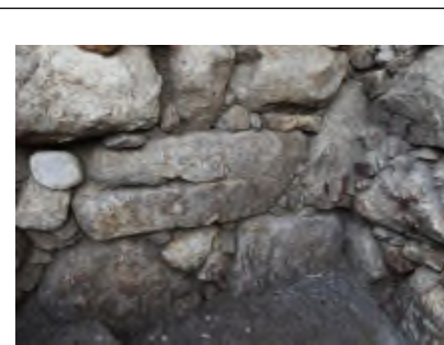
写真5 No. ③石垣 入隅部

（地上部と合わせて高さ4.5m）が、石垣の最下端には至らなかった。検出した石垣には刻印が見られる。刻印は①「□」②「ㄧ」③「㊦」の3種類で、①と②は1つの石に刻まれている。