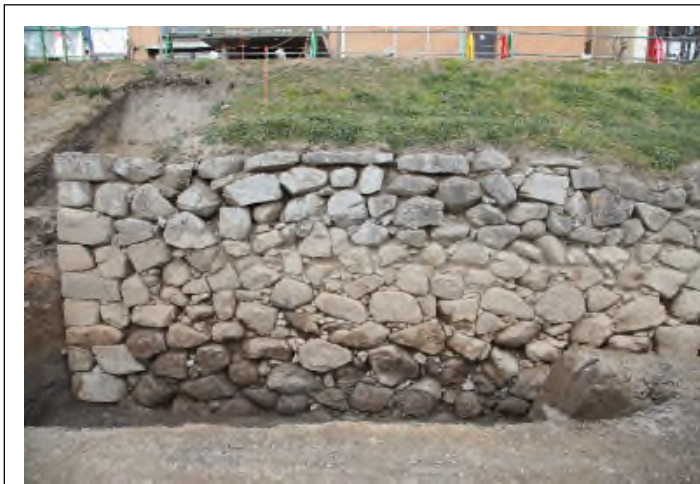
写真11 No. ⑥西側石垣

石垣隅部は「算木積み」で積まれている。また石垣は「打込み接ぎ」で積まれるが、東側は矩形の石材を横目地を通して積むのに対し、西側では角が取れた石材で目地が不明瞭である。石垣を積む工人の違いや補修等による積み方の違いが想定されるが詳細は今後の検討課題。