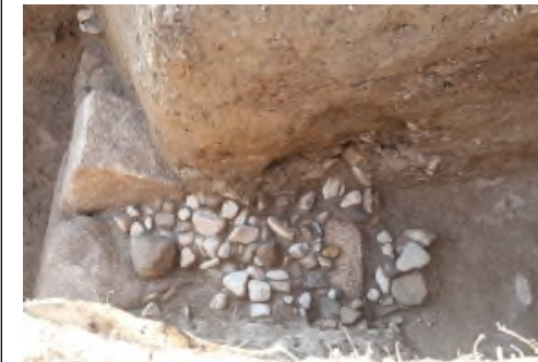
写真 2 石垣背後裏込め石

裏込め石は近辺で取れる川原石の円礫 (直径 10～20 cm) が主体であるが、川原石よりも大きい花崗岩も若干含む。裏込め石は石垣背後に約 1.5m の範囲で充填されている。