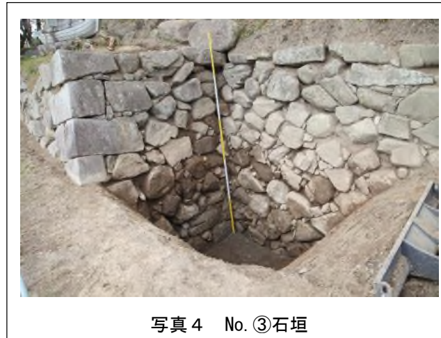
写真4 No. ③石垣

3つある「横矢柵形」のうち、真ん中の横矢柵形に位置する。横矢柵形の入隅部分（二つの面が入りあってできる角）の構造を確認するために調査区を設定した。入隅部の石材は一段ごとに互い違いに石垣内部に入り込む形で組み合わされている。