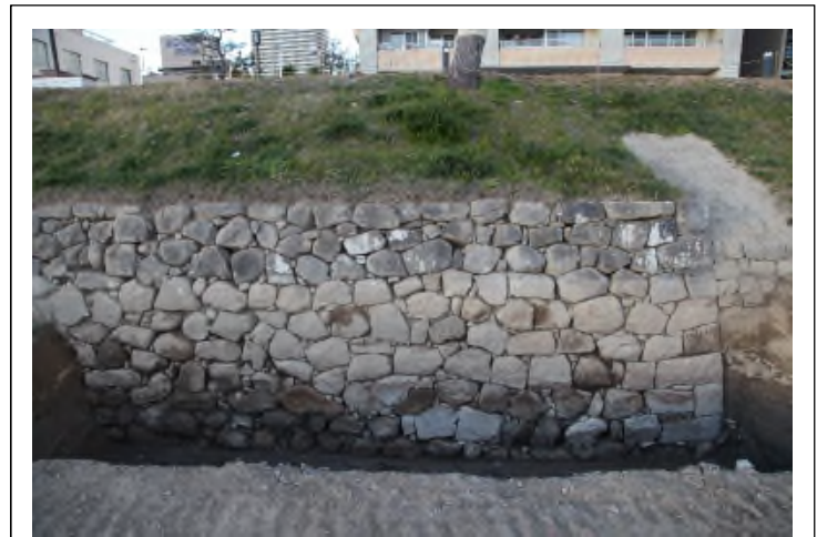
写真12 No. ⑥東側石垣