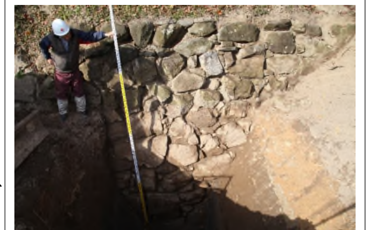
写真 3 No. ②石垣

調査地点は樹木 (桜) が近接しており、樹木の根が石垣に影響を与えていないか確認するために調査区を設定した。調査では石垣を 2.5m まで確認した (地上部と合わせて高さ 3.8m) が、石垣の最下端には至らなかった。掘削した最深部で立沢瀉文軒丸瓦が出土した。石垣は孕みは少ないものの、石垣上部法面にある樹木の根が石垣背後から生えてきており、石垣の石材間を埋める「間詰め石」を崩す要因の一つになっているものと考えられる。