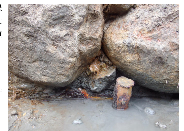
写真13 根石および胴木