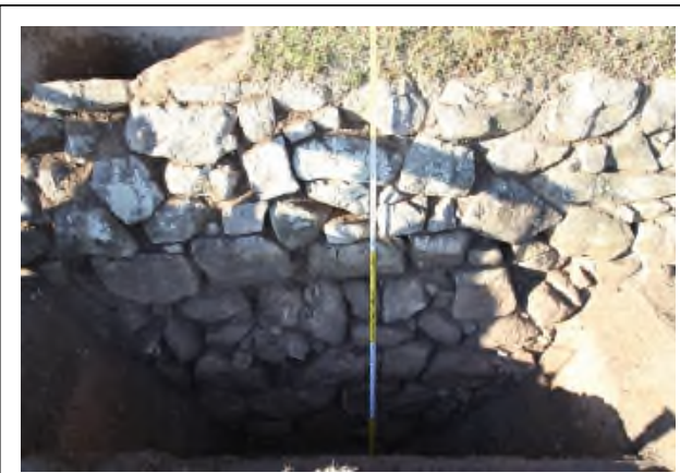
写真6 No. ④石垣

慶応2年（1866）12月の城郭修復伺絵図『参河國岡崎城破損所覚』に「菅生門塀下石垣崩」とあり「此所石垣 高一間二尺（2.42m） 幅二間半（4.54m）崩」の記述と一致する。この修理伺いに対する老中奉書は確認されておらず、修復されたかは不明。