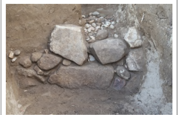
写真 1 No. ①石垣 (西端付近)

石垣の「折れ」ないし土塁との境目を検出する目的で調査区を設定した。調査では石垣を検出したが、石垣天端石はなく上部は削平ないし崩落したものと思われる。調査区内で石垣の「折れ」や土塁の境目は確認できず、この地点よりさらに西側にあるものと考えられる。