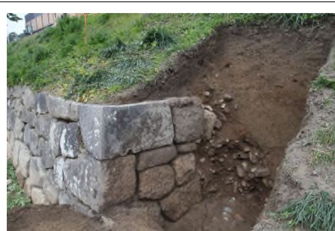
写真7 No. ⑤石垣（隅部の折れ） 一部崩落により裏込め石が流出

石垣下層部を部分的に深掘りしたところ、石垣根石および胴木を確認した。胴木は松材で胴木を抑える縦杭も1本確認された。胴木の発見により、石垣の総高（根石の下端から天端までの高さ）が5.4mであることが判明した。