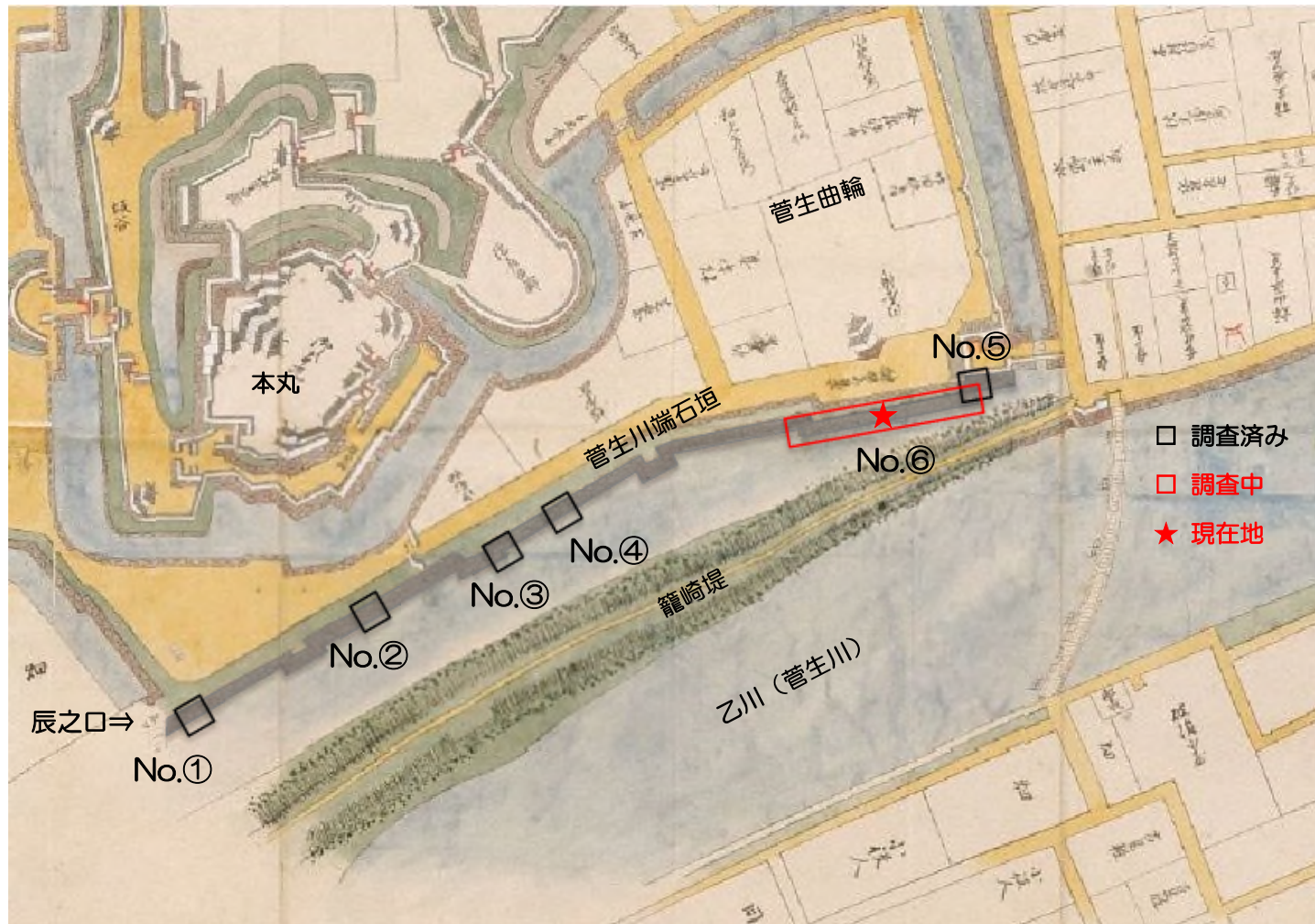
図 1 岡崎城絵図における菅生川端石垣