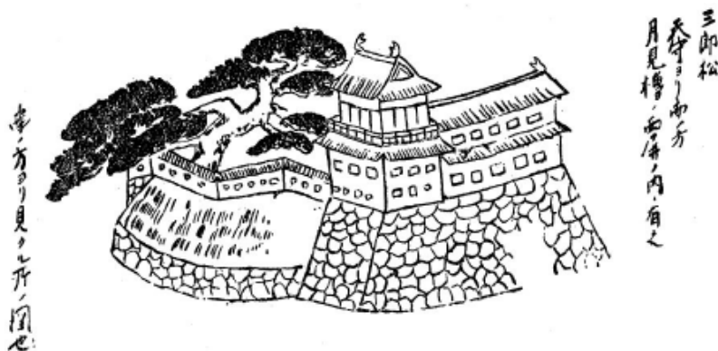
松下鳩臺の描いた月見櫓（江戸時代後期）

名前のとおり、「お月見」をする建物のことであり、絵図で「月見櫓」と表記されることもあります。実際にこの櫓でお月見をしたかはわかりませ