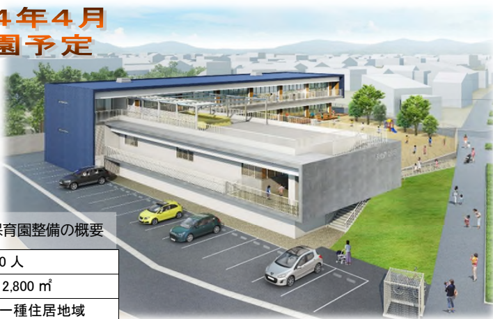
(仮称)若松西保育園整備の概要