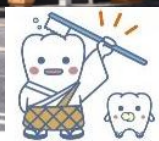
(日本歯科医師会キャラクター「よ坊さん」)