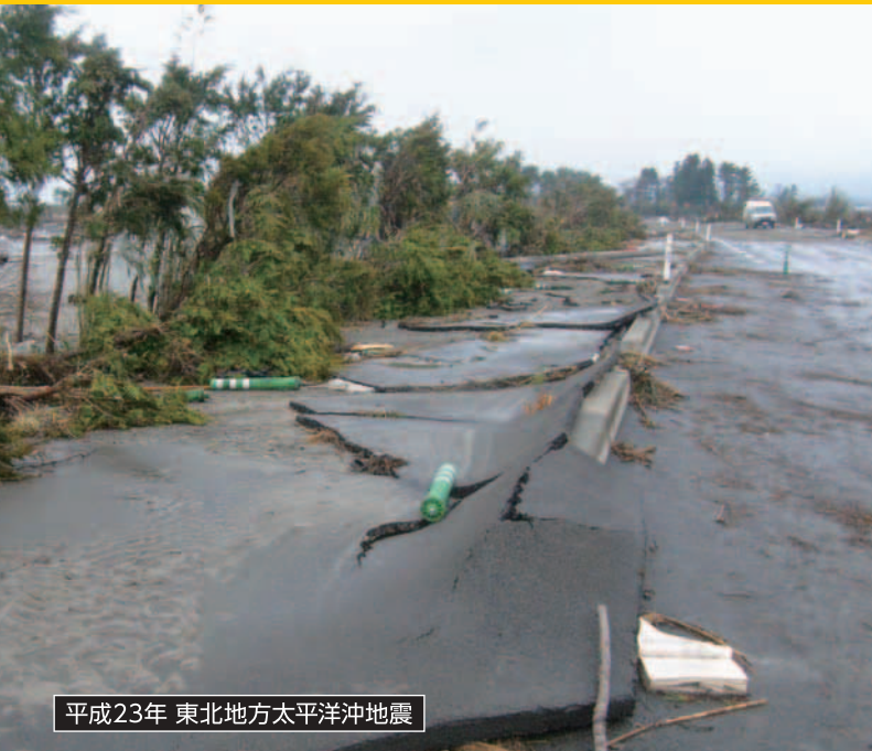
平成23年 東北地方太平洋沖地震