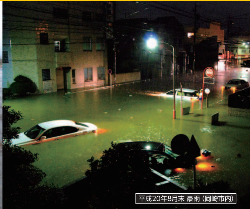
平成20年8月末 豪雨 (岡崎市内)