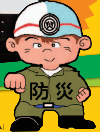
イメージキャラクター「防災くん」