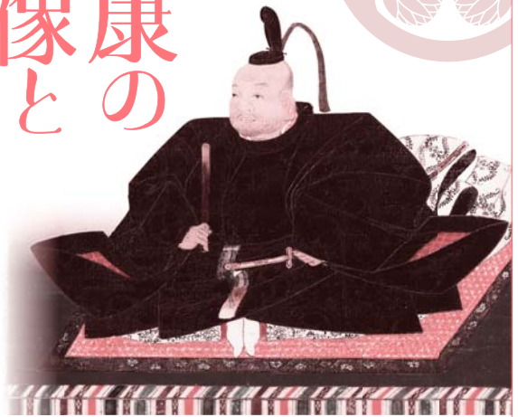
東照大権現像（部分）四代木村了琢筆 天海賛 徳川記念財団蔵

岡崎市美術博物館 [マインドスケープ・ミュージアム] 高隆寺町峠1番地 岡崎中央総合公園内 ☎28・5000 FAX28・5005