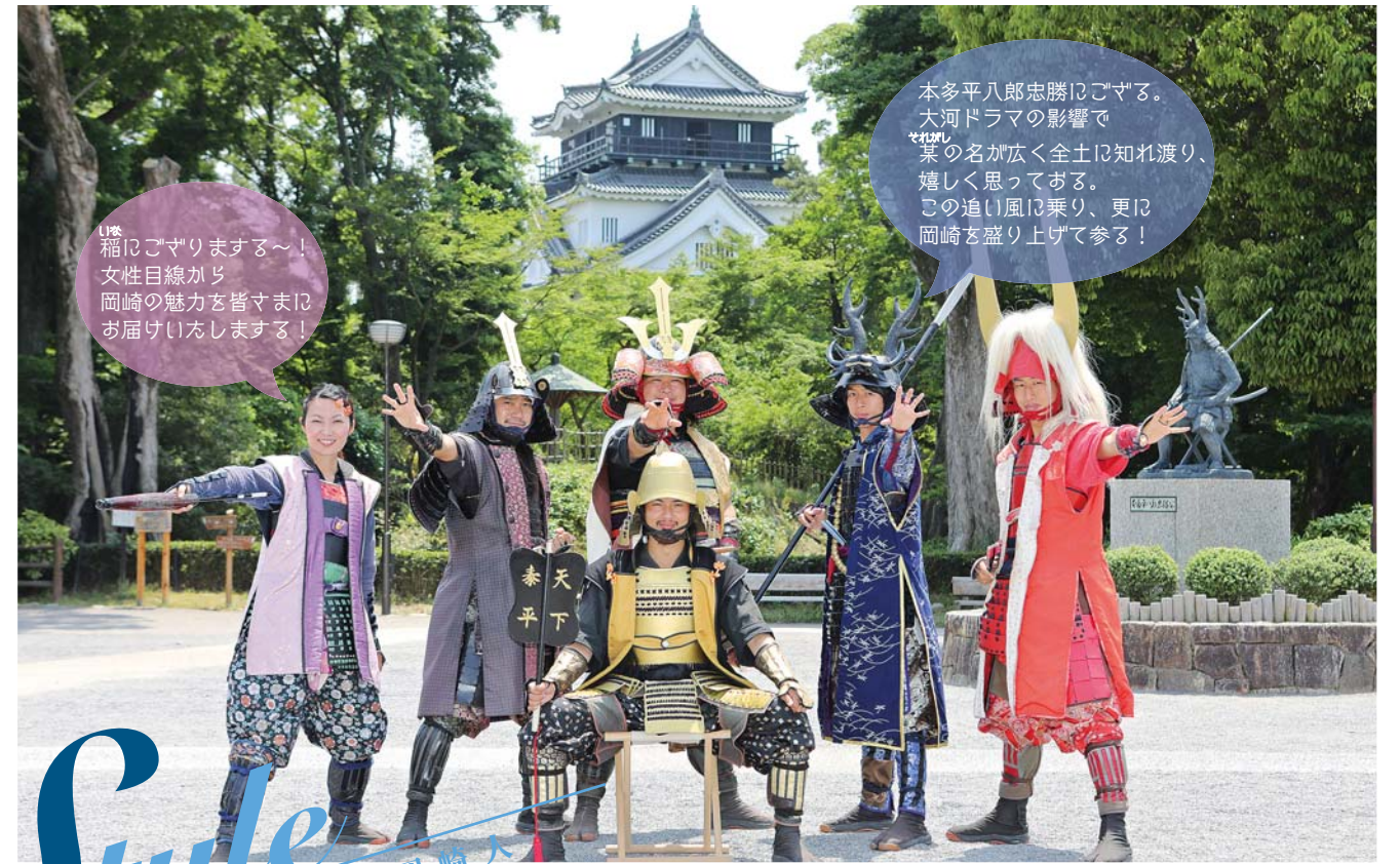
▲(中央前)徳川家康、(左から)稲姫(新人)、榊原康政、酒井忠次、本多忠勝(新人)、井伊直政