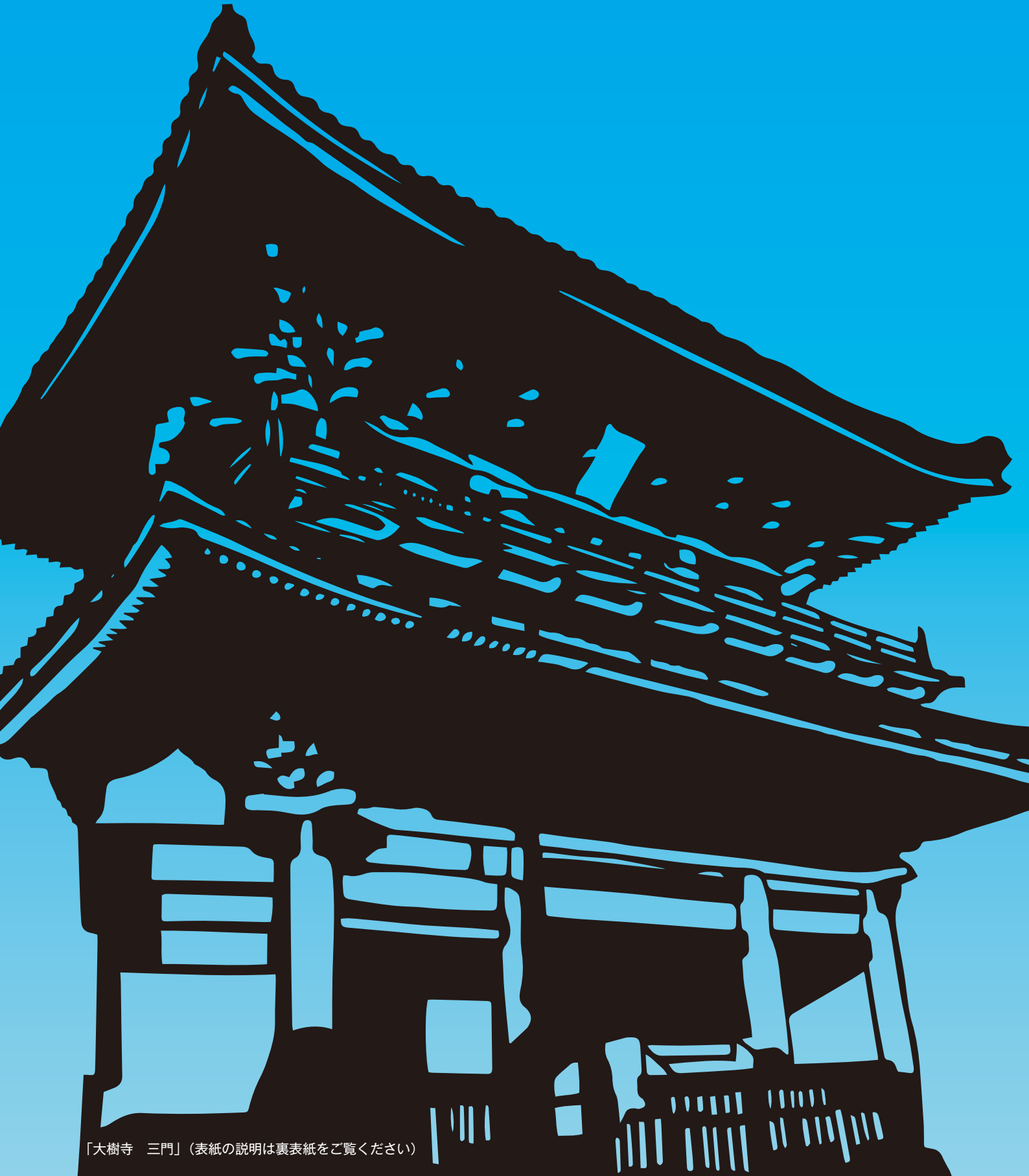
「大樹寺 三門」(表紙の説明は裏表紙をご覧ください)