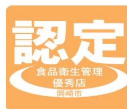
岡崎市食品衛生管理優秀店認定マーク