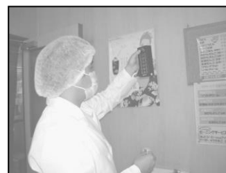
使用水の残留塩素測定