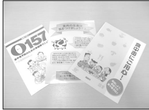
食中毒防止等啓発資料