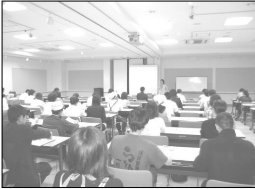
食品衛生責任者再講習会