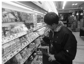
流通施設での収去（抜き取り）

443 検体の収去検査を実施しました（表6）。 その結果、5件の違反がありました（表17）。