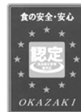
岡崎市食品衛生管理 優秀店認定ステッカー