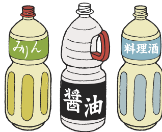
しょうゆ・酒類(酒・焼酎・みりん)の ペットボトル