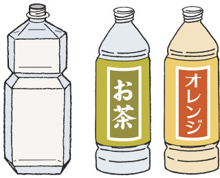
飲料用のペットボトル ※色付きのペットボトルも回収しています。