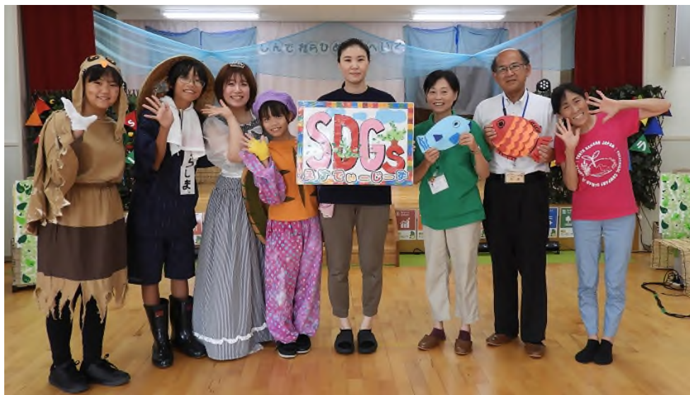
←劇団シンデレラや保育園のみなさんと一緒に

今回のイベントのように、多彩な人たちと協力して、地球温暖化と関連するさまざまな課題も合わせながら、共に声をかけあって楽しいまちにしていきたい。そう思えたひとときでした。岡崎市のあちこちでそんな温かなひとときが増えていくことが、私たちのSDGs啓発活動です。会員のみなさんの想いも共に未来へ向けて活動していくために、今後もさまざまな工夫を重ねてまいります。どうぞよろしくお願いいたします。