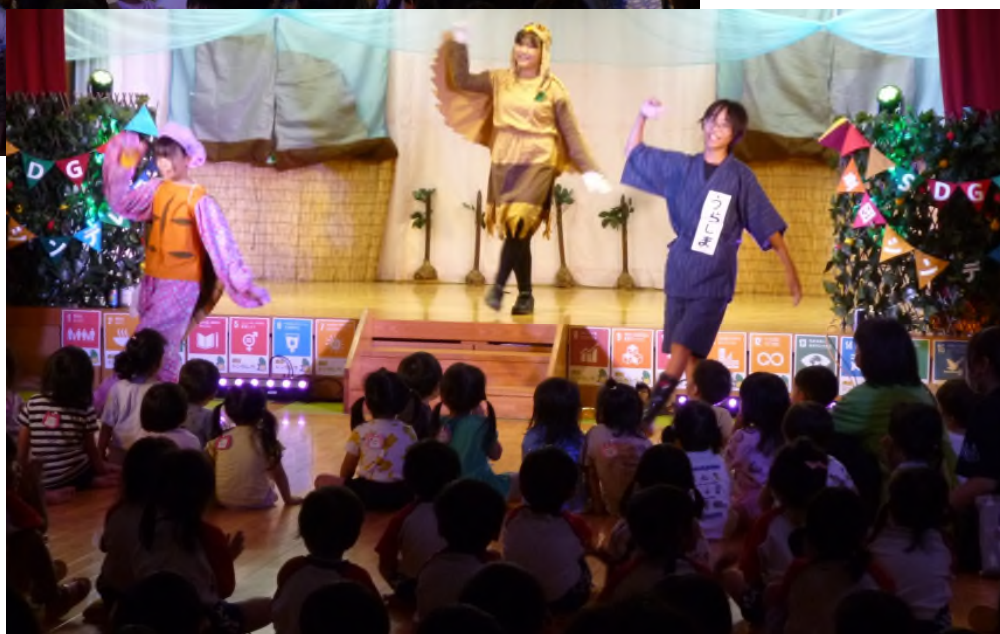
ライトや音響なども使ったダンス演出で、目が釘づけに→