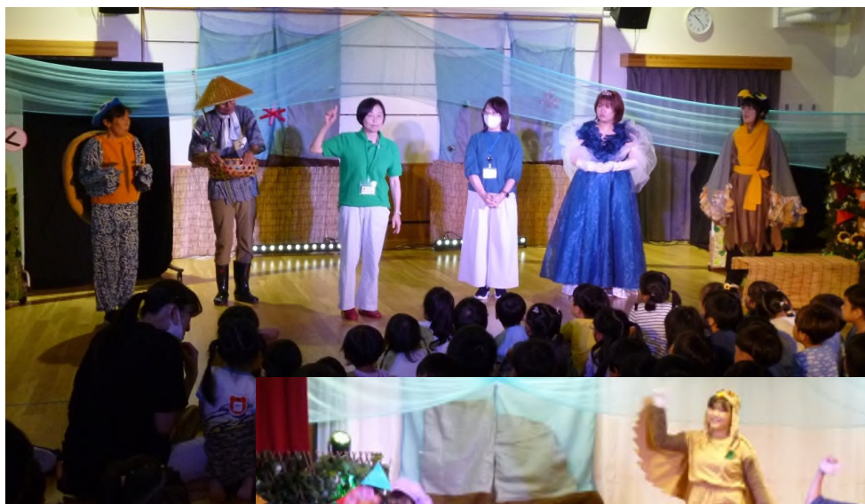
←緑のシャツを着た防止隊メンバー

劇のタイトルは「しんでれらひめうみへいく」。キャストは小学生、中学生、大学生の子どもたちです。年の近いお兄さんとお姉さんが、舞台から降りて語りかけたり、歌い踊りながら盛り上げたり……。さらに私たち防止隊のメンバーや園長先生も舞台にあがって、海の生きもののごみ・プラスチックや温暖化、汚染の問題をオリジナルのストーリーで演じ「海をきれいにし、海の生きものを守るための取り組み」を園児と一緒に考えました。