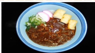
カレーうどん(きしめん) 700円 小 乳 た