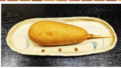
アメリカンドッグ 300円 小 乳 た