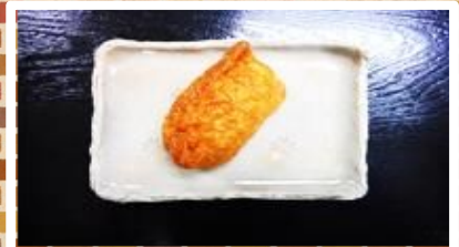
いなり寿司(1個) 100円 小