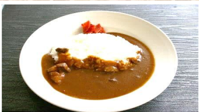
カレーライス(サラダ付) 730円 小 乳 た