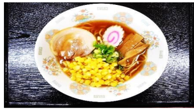
コーンラーメン 600円 小 た