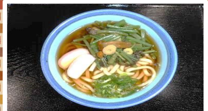
山菜うどん(きしめん) 570円 小 乳 た