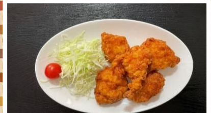
からあげ(5個) 450円 乳 た