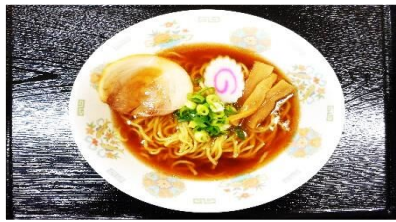
ラーメン 550円 小 た