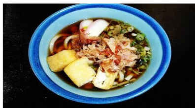
うどん(きしめん) 520円 小 乳 た