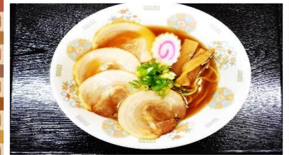
チャーシューメン 700円 小 た