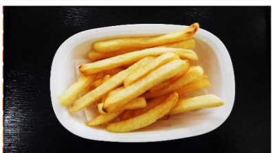
フライドポテト 280円