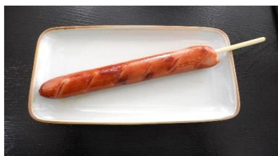
フランクフルト 280円 小 乳 た