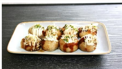
たこ焼き 500円 小 た