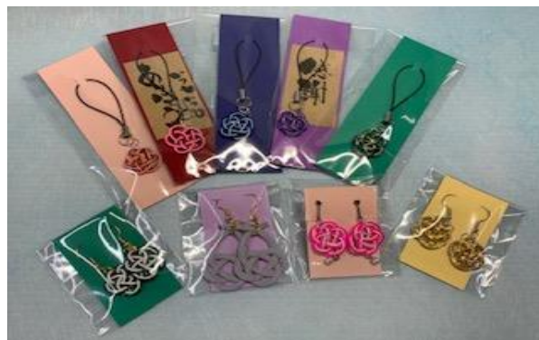
【自主製品(水引小物)】