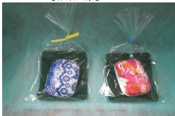
【自主製品(デコパージュ石鹸)】