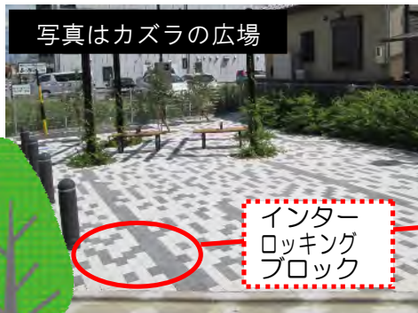
インターロッキングブロック