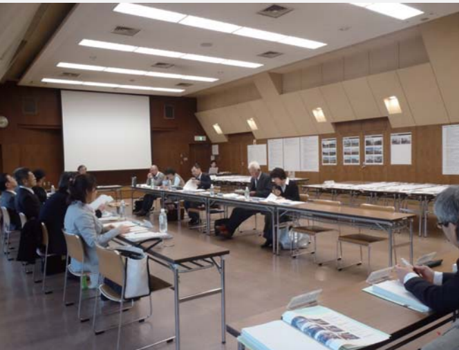
■一次審査（書類審査）