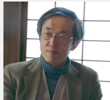
岡崎市景観審議会会長 (名古屋市立大学名誉教授)