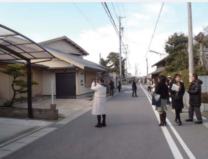
■二次審査（現地審査）