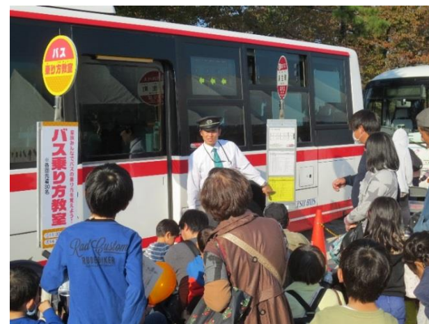
「公共交通に親しむ日」バスの乗り方教室