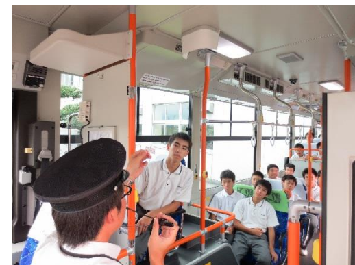
市内中学校で実施した乗り方教室