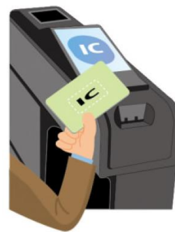
ICカード利用イメージ