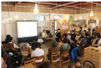
●創業セミナー(イメージ)