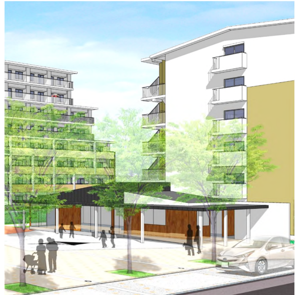
平地住宅放課後児童クラブ完成イメージ図