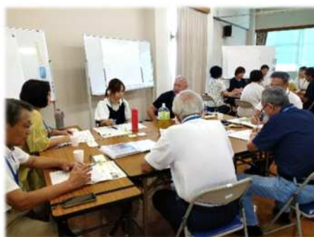
①アイスブレイクと意見の洗い出し