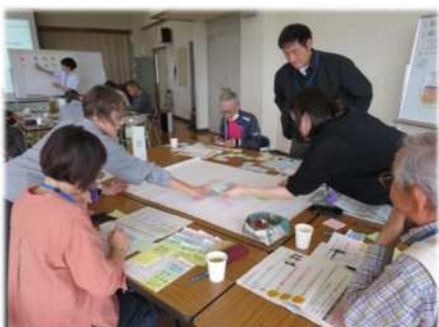
②アイデアの共有と優先度マップ作成