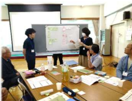
②多様な視点でのグループワーク