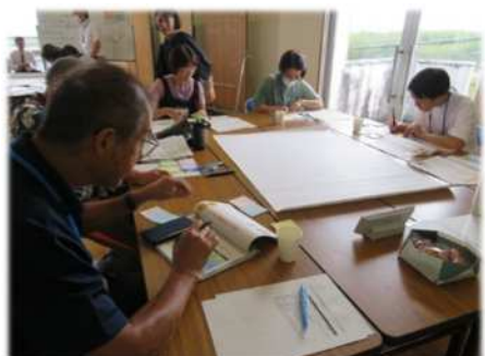
①多様な視点に立ったアイデア発想