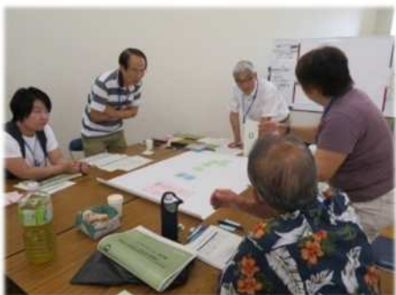
②アイデアの共有と夢の施設マップ作成