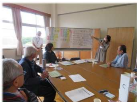
③成果の共有と共感の醸成