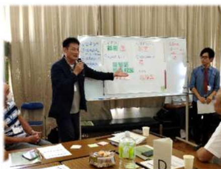
③成果の共有と共感の醸成