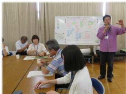
③成果の共有と共感の醸成