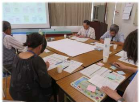
①多様な視点に立ったアイデア発想