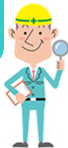
東岡崎駅周辺地区整備スケジュール(予定)

右表の中の工事場所は、前のページの「東岡崎駅周辺地区整備完成イメージ図」を参考にしつね。