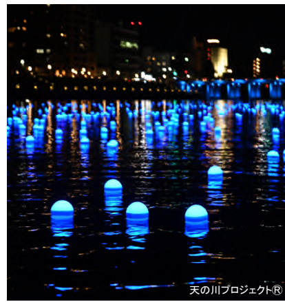
天の川プロジェクト

★ 屋内有料駐輪場 <H31.6月頃オープン予定> 東岡崎駅周辺の民間事業者 による複合商業施設内に設置