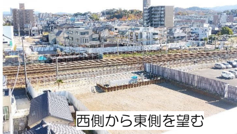
西側から東側を望む