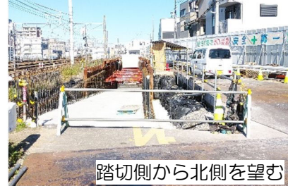
踏切側から北側を望む