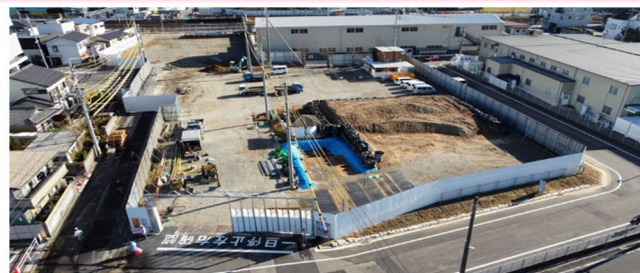
【11月の工事状況写真】