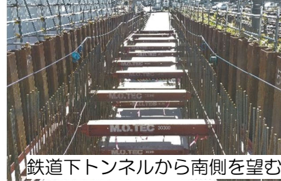
鉄道下トンネルから南側を望む