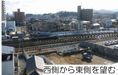
西側から東側を望む