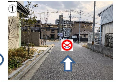
① 南方向の通り抜けができなくなります。