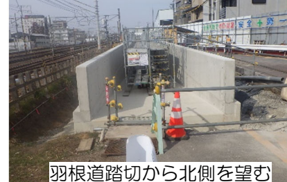
羽根道踏切から北側を望む