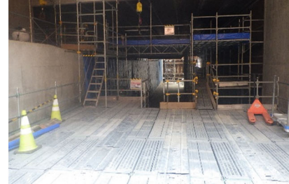
内装工事状況写真