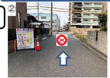
② 北(JR岡崎駅)方向の通り抜けができなくなります。