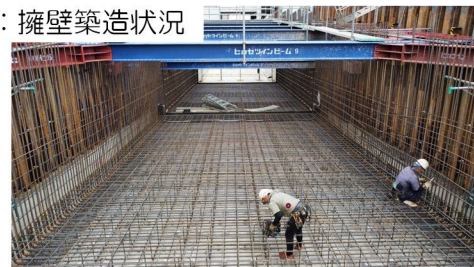
写真A：擁壁築造状況