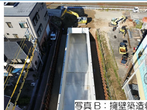
写真B：擁壁築造状況