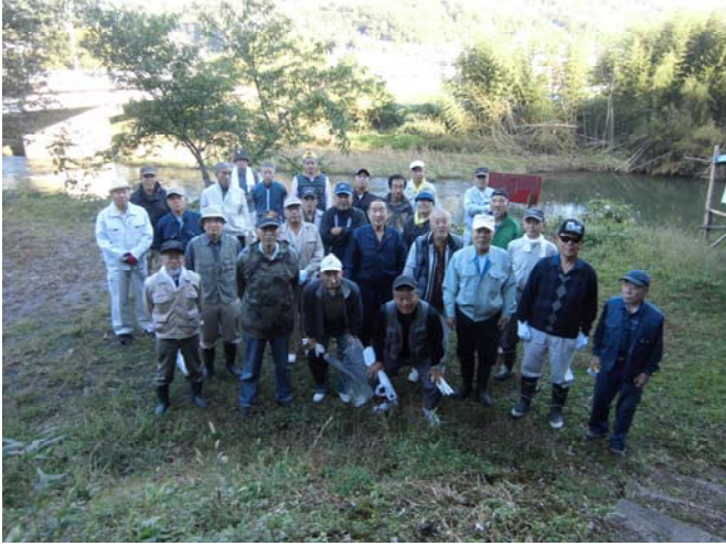
10月27日（日）乙川河川敷（美保橋付近） 活動の様子