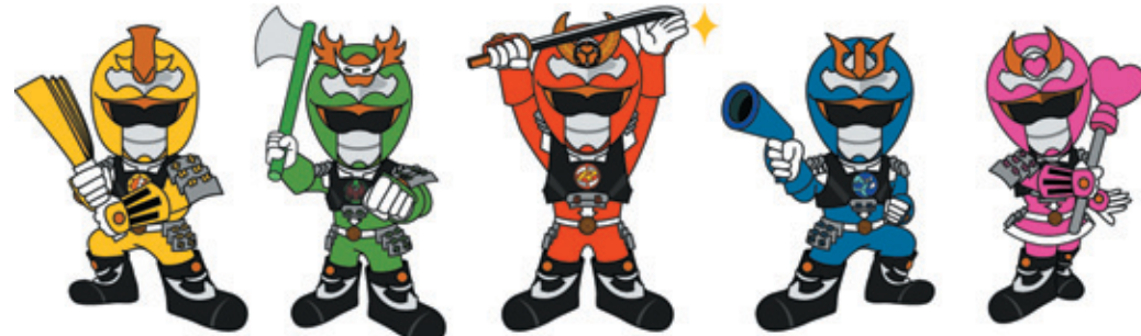
エコマイエロー康政