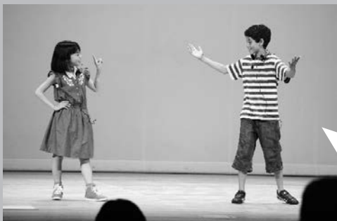
イングリッシュ・フェスティバル

身振り手振りを工夫しながら伝えようとする姿が見られる。小学生スキットの部があるのは、県内でも珍しい。(総合学習センター)