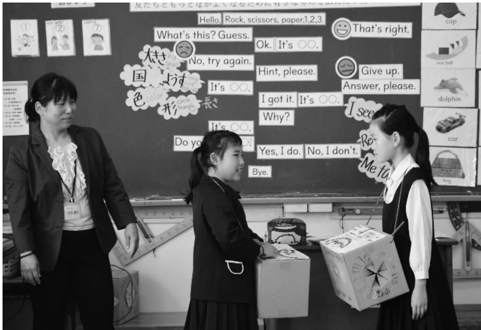
▲みんなの前で会話のデモンストレーション（六名小学校）