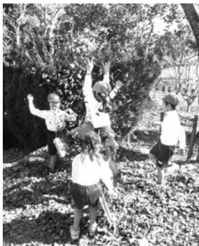
落ち葉を集めたよ(常磐東小)

「つながる喜び」。交響曲第九番の歌詞における大きなテーマであるとともに、米津氏が会のメンバーに味わってもらいたいと考えているものでもある。 目の前にいる子供たちは、つながる喜びを味わっているだろうか。改めて考えてみる。