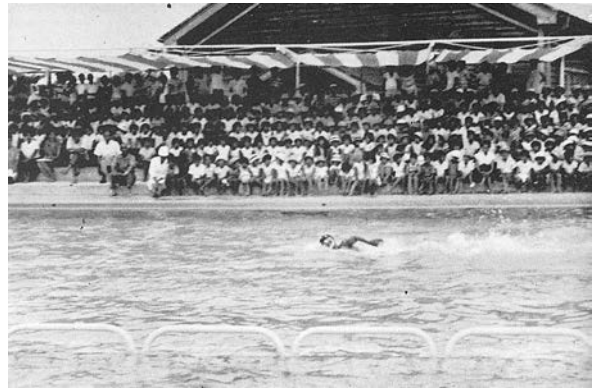
▲ 東京オリンピック代表 福島選手の模範泳ぎ

冬至を待たずに感じる厳しい寒さ。校庭の花壇にはノースポールが咲いている。花言葉は「誇り」。 最上級生として学校を引っ張ってきた卒業生との生活も、年を越せばあとわずか。学校生活を充実させてきた誇りを胸に、より一層躍動させたい。