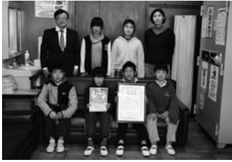
▲1. 12令和元年度1.17防災未来賞「ぼうさい甲子園」小学生の部 奨励賞 常磐東小