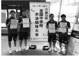
▲8.17令和元年度全国中学校体育大会 水泳400mメドレーリレー7位 甲山中