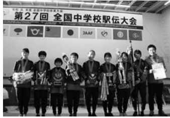
▲12. 15第27回全国中学校駅伝大会女子の部 優勝 六ツ美北中