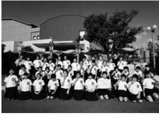
▲9.7第66回NHK全国学校音楽コンクール東海北陸ブロックコンクール 小学校の部 銀賞 梅園小