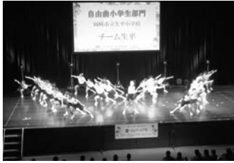
▲12. 26第7回全国小中学校リズムダンスふれあいコンクール自由曲小学生部門 2位 生平小