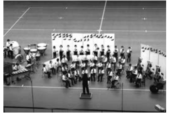
▲11. 23第38回全国小学生バンドフェスティバル銅賞 竜美丘小