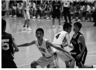
▲7.28第73回愛知県中学校総合体育大会 バスケットボール男子優勝 葵中