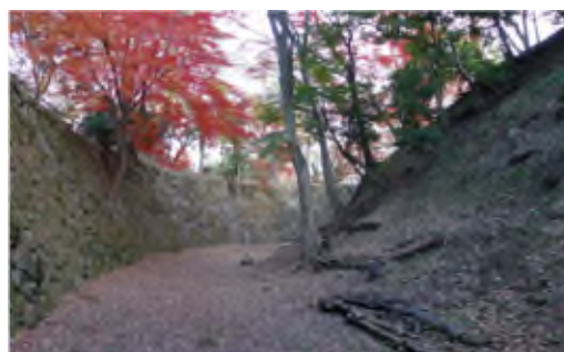
清海堀の土塁と石垣