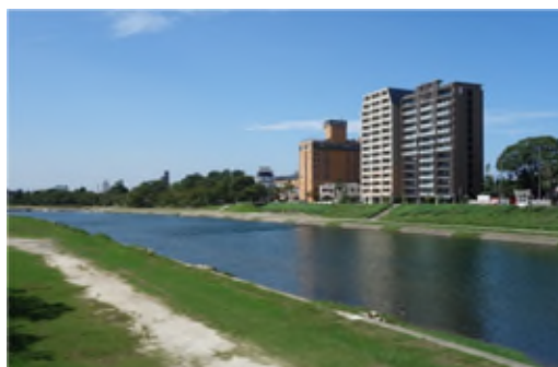
菅生川(乙川)の殿橋からの景観