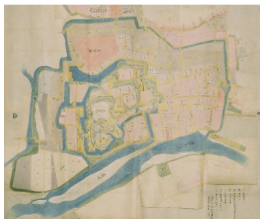
岡崎城絵図(江戸後期)に見る縄張り