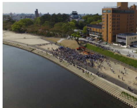
菅生川端石垣の発掘調査現地説明会