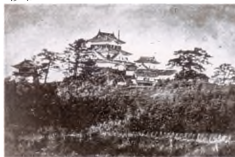
本丸周辺の古写真（明治5年頃）