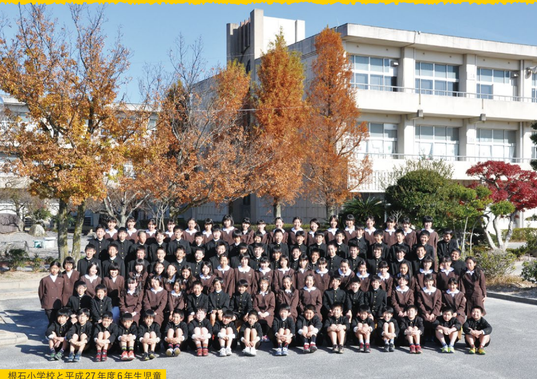
根石小学校と平成27年度6年生児童