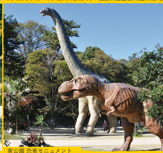
東公園 恐竜モニュメント