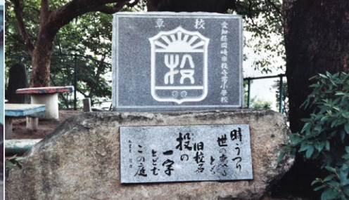
2 根石小にある投尋常小学校校章の碑