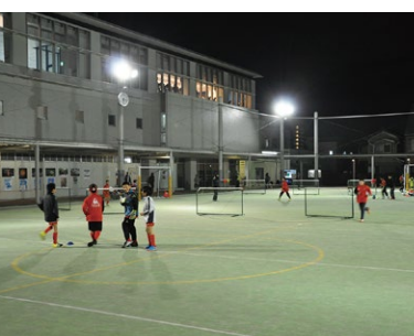
F 岡崎げんき館・岡崎市保健所

(旧額田郡公会堂・物産陳列所) 公会堂と物産陳列所が一緒に現存する、貴重な国指定重要文化財