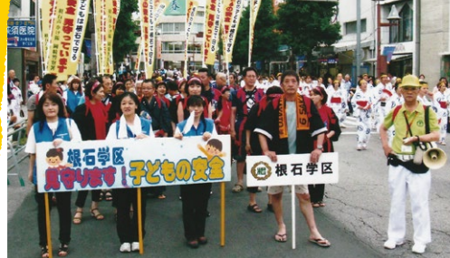
根石学区民が参加した「五万石おどり」