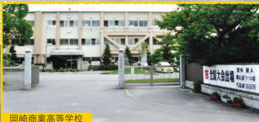
岡崎商業高等学校