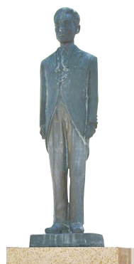
せきれいホール前の博士の銅像

根石小時代（昭和12年卒）は算数が得意だった博士は、集団遺伝学を数学理論で解明し、昭和63年に国際生物学賞平成4年にダーウィンメダルを受賞。その栄誉をたたえ、地元の方々の協力のもと、博士の自宅に近いせきれいホルの敷地内に、銅像が建てられました。