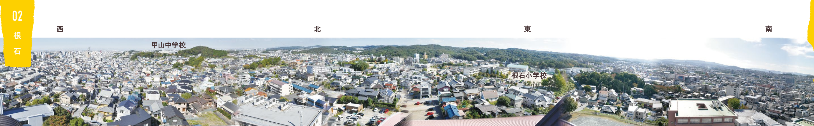
岡崎女子大学の屋上から見た根石学区の風景