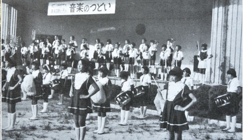
根石小PTA主催の「親と子の音楽のつどい」

毎年、岡崎観光夏まつりがあります。伝馬通りで開催された五万石おどりでは、根石学区は「根石学区連」のプラカードを先頭に、女性部を中心に老若男女200名以上が参加しています。「誰れもが住みたいわがまち根石」「根石のこどもは根石で守る」の幟を背に踊ります。この幟に託された思いが学区の活動となっています。（↓写真6） 学区では、総代会をはじめ、各種団体が連携して力を合わせ行動します。総合防災訓練（中学生を含め1000名以上）、学区夏まつり（小学生を含め2000名以上）、学区民体育祭（各町参加で1500名以上）、青色回転灯車による防犯パトロール（毎日出動）など多くの行事を通して安全で安心して生活できる温かみのある学区になるよう学区民が協力し活動しています。