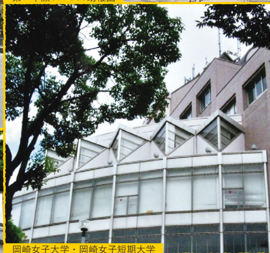
岡崎女子大学・岡崎女子短期大学