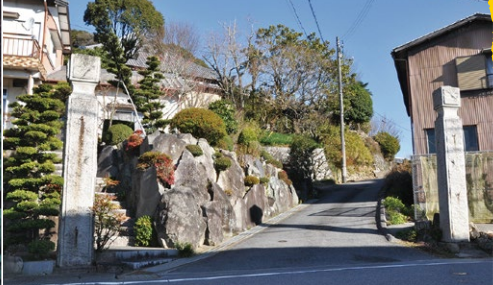
1 投尋常小学校の校門。現在は小美町順正寺に立つ