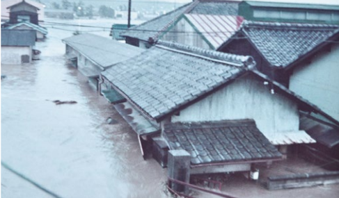
3 台風23号の水害(栄町)