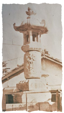
両町にあった岡崎宿最古(1790年建立)の常夜燈

学区内には、火伏の神様である「秋葉山常夜燈」、伊勢信仰の「大神宮常夜燈」などさまざまな常夜燈があります。一部戦災などで破損、修復移築をされながら、欠町、若宮町、中町大門通、中町東丸根、栄町、朝日町に残されています。秋葉山常夜燈は、年1回、秋葉山に代参し、お祀りしています。