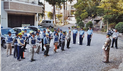
防災防犯パトロール出発式