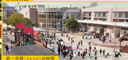
第一早蕨(さわらび)幼稚園