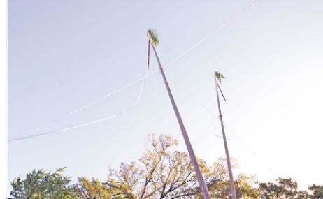
いいぞ、その調子だ、あともう少し