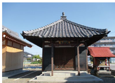
A 薬師堂 牧御堂という町名の由来になった御堂。毎日、各戸が交替で「おぼこさん（おぶくさん・仏飯）」を供え、大切にしている

六ツ美北部学区は昭和60年代から新しい道が井桁状に開通しました。特に県道桜井岡崎線、市道井内新村線沿線はスーパーやショップ、郊外型の飲食店が建ち並び、風景が一変しています。