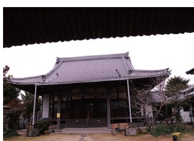
G 常楽寺 かつては下和田町と坂左町との境界付近にあったが、いつの頃から下和田城の跡地と伝わる現在地に移転