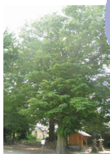
犬尾神社の大けやき。樹高18.0m、幹回り2.7m、根回り4.5m、枝張り18.0mの美しい樹姿