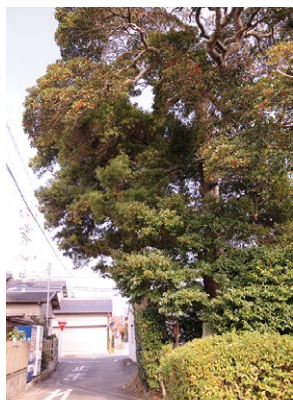
F 毘沙門天のホソバ 樹齢200年以上のホソバ。何か起こると天狗が降りてくると伝わる