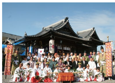
B 井内八幡宮 神龜2年（725）の創建、久世の殿様ゆかりの地。久世という字名が今も使われている