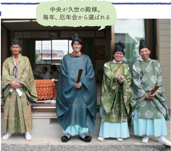
中央が久世の殿様。毎年、厄年会から選ばれる