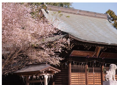
E 犬尾神社 千余年の歴史を誇る古社。境内には遊具もあり、子どもたちの遊び場になっている