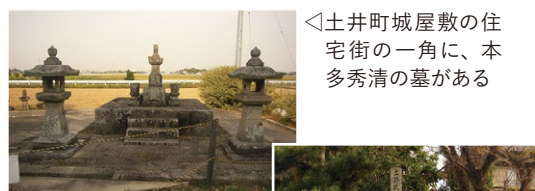
◀土井町城屋敷の住宅街の一角に、本多秀清の墓がある