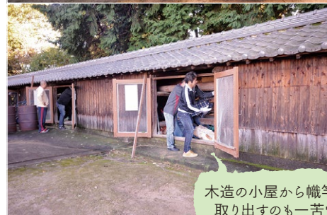
木造の小屋から幟竿を取り出すのも一苦労