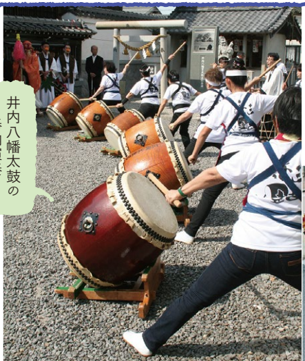
井内八幡太鼓の奉納演奏