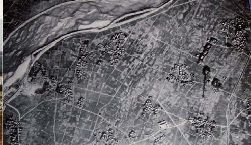
1 田畑が広がっていた昭和23年の六ツ美村。左上に矢作川、右端に占部川が流れる