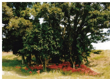
C 埋葬基地の森 占部川の左岸にある小さな森。戦前、小さな子どもが亡くなると土に埋めて葬った。犬や猫、ヤギなどの動物も一緒に眠っている