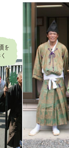
行列の先頭を天狗が歩く