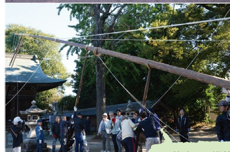
竿立ては幟竿を支えるのに必須