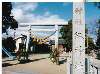
D 鉾神社 農事の守護神を祀る社。御守護符（ごしゅごふ）も授与している。毎年10月第3日曜日に秋の例大祭が行われる