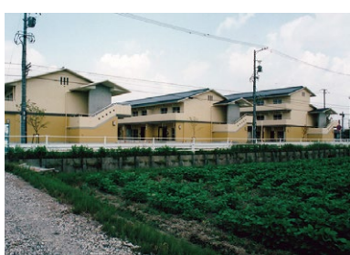
H 市営土井住宅 平成22年に2階建てから5階建ての10棟にリニューアル。六ツ美北保育園や土井公園も併設し、子育て世代に人気