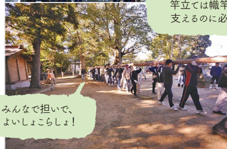
みんなで担いで、よいしょこらしょ！