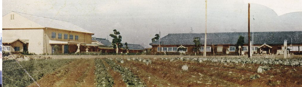
2 昭和40年頃の六ツ美北部小学校