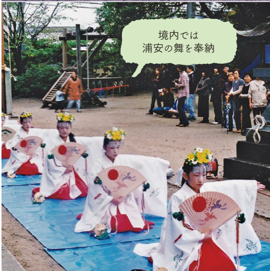
境内では浦安の舞を奉納