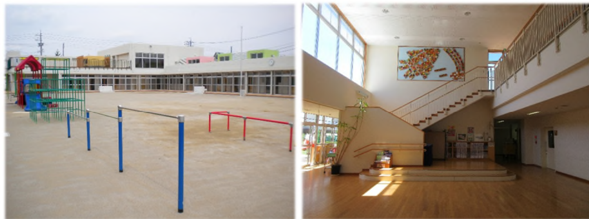
岡崎市六ツ美北保育園の概要

現在の法制度下では、私立保育所等に国や県から手厚い財政支援が実施されていることから、移管することで生まれる財源を活用し、老朽化した園舎の建替えや多様化する保育ニーズへの対応など、保育環境の向上や保育サービスの拡充を図ることを目的としている。