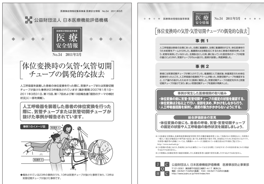
図表Ⅲ-3-17 医療安全情報No.5 4 「体位変換時の気管・気管切開チューブの偶発的な抜去」