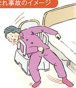
はさまれ事故のイメージ

ご使用中のお客様には大変ご迷惑をおかけいたしますことを深くお詫び申し上げます。何卒ご理解とご協力をお願い申し上げます。