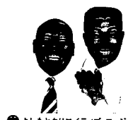
◎ よしもとクリエイティブ・エージェンシー

2014年にコンビで介護職員初任者研修の資格を取得! 数多くの介護・福祉に関するイベントで講演やあるあるネタを披露。