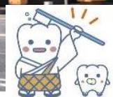
(日本歯科医師会キャラクター「よ坊さん」)