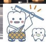
(日本歯科医師会キャラクター「よ坊さん」)