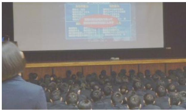
↑ 体育館での講座の様子