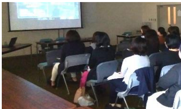
↑ 各クラスでの講座の様子