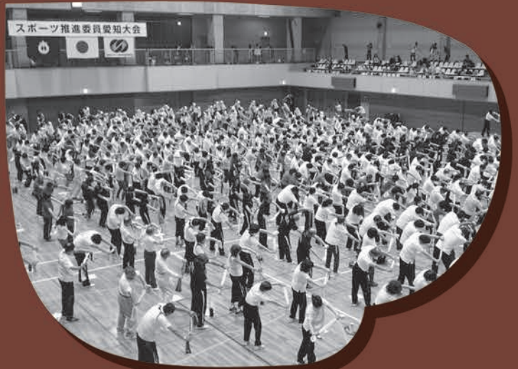
上段：第22回岡崎市スポーツ・レクリエーション祭 (28.6.12)