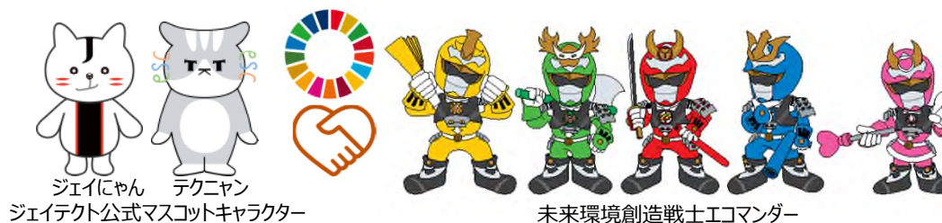
ジェイにゃん テクニャん ジェイテクト公式マスコットキャラクター