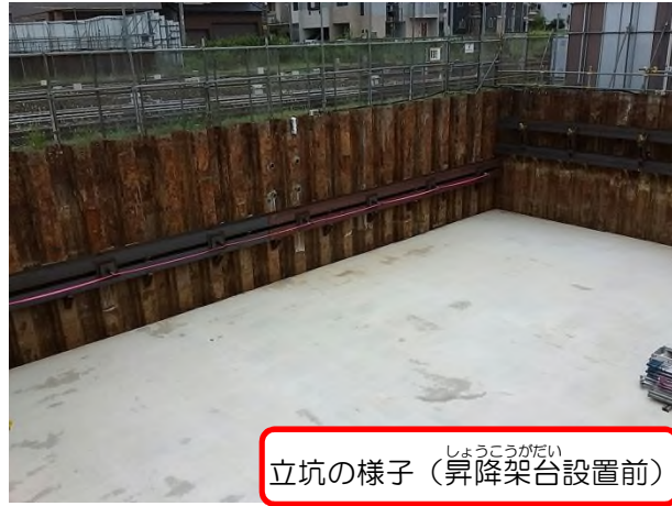
立坑の様子（昇降架台設置前）