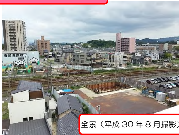
全景（平成30年8月撮影）