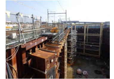
上床版エレメント施工後