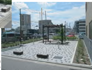
フジの広場 平成25年4月完成