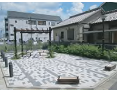
カズラの広場 平成25年4月完成