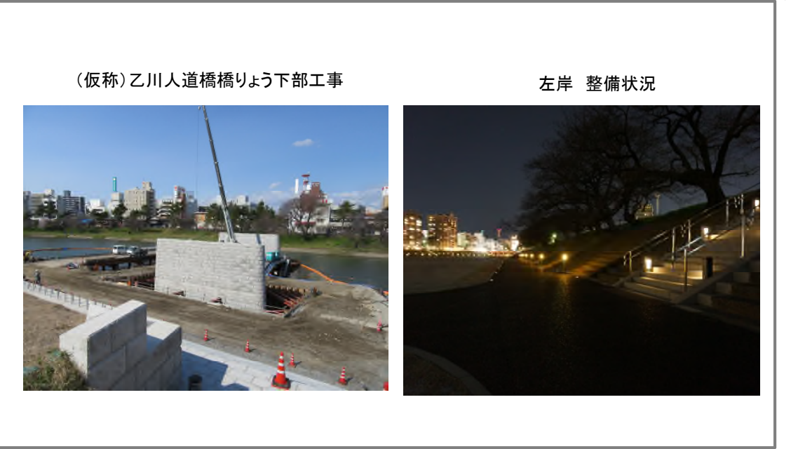
(仮称)乙川人道橋橋りょう下部工事