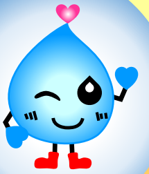
みず ようせい 水の妖精 スイットくん