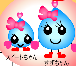
スイートちゃん すずちゃん

みなさん、こんにちは スイットくんだよ！ こんかい なつ やす ちゆう おこ 今回は夏休み中に行われるイベントを紹介するよ！ しようかい