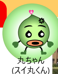
丸ちゃん (スイ丸くん)

概要：岡崎市はじめ矢作川流域の4市1町を処理区域とする県内 最大の下水処理場。施設見学と併せて微生物観察実験も 体験する盛りだくさんの内容に乞うご期待！