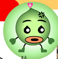
まる 丸ちゃん (スイ丸くん)

概要: 岡崎市はじめ矢作川流域の4市1町を処理区域とする県内最大の下水処理場。施設見学と併せて、微生物観察実験も体験する盛りだくさんの2時間半です！