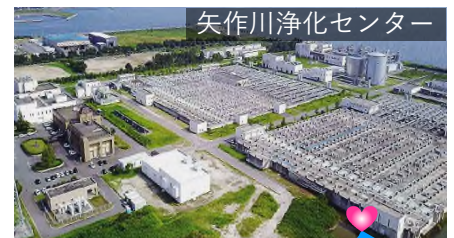
矢作川浄化センター