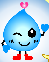
みず ようせい 水の妖精 スイットくん