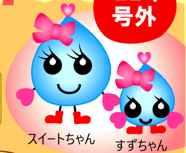
スイットちゃん すずちゃん

みなさん、こんにちは スイットくんだよ！ こんかい なつ やす ちゆう おこな しょうかい 今回は夏休み中に行われるイベントを紹介するよ！